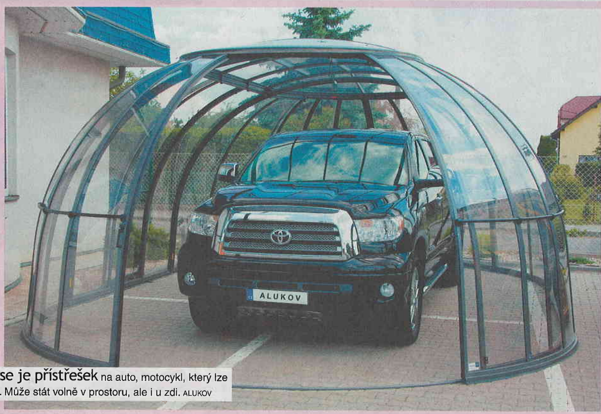
Carhouse je přístřešek na auto, motocykl, který lze uzamykat. Může stát volně v prostoru, ale i u zdi. ALUKOV

Developerské projekty obvykle počítají s jednou garáží, přitom v rodině se využívají běžně dvě auta. Ve starší zástavbě rodinných domů se dokonce ani s garážemi původně nepočítalo a dnes mají majitelé velký problém. Kam s ním?